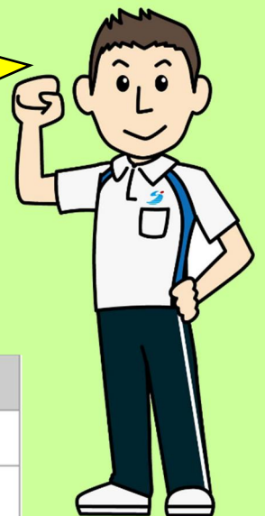
東広島運動公園トレーニングルーム利用料金表(1時間あたり)

ストレッチポールやバランスボール等を使った軽めの運動や、 自宅でも簡単におこなえるストレッチ・筋力トレーニング等を ご紹介します！是非ご参加ください♪